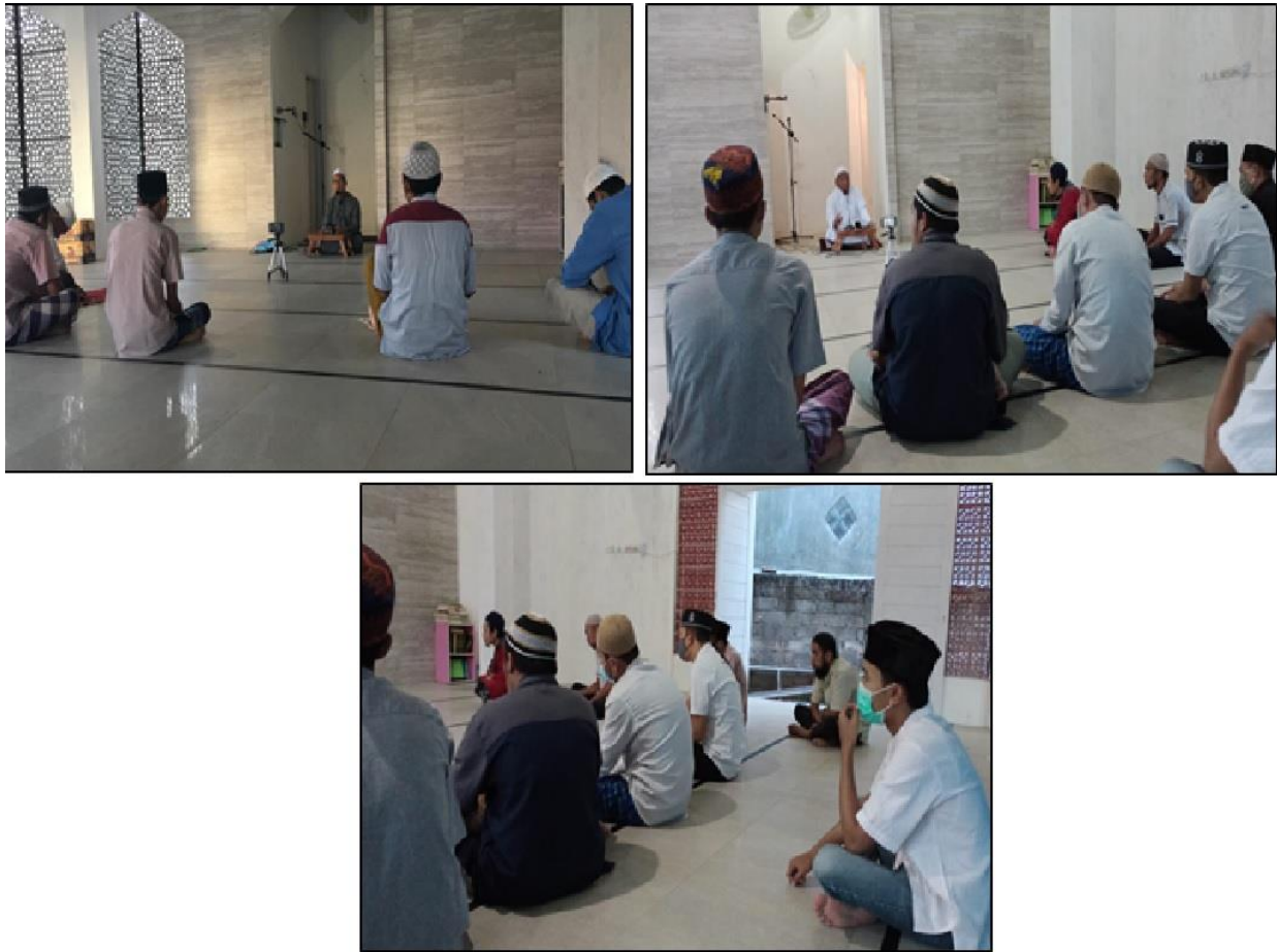
FIGURE 2 / Proses Pembelajaran Tahsin Metode Asy-Syafi'i